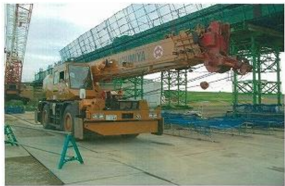
ラフテレーンクレーン