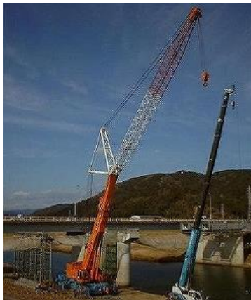
トラッククレーン