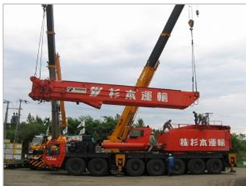
オールテレーンクレーン