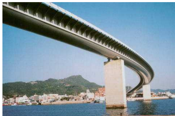
牛深ハイヤ大橋（熊本県）

また、全国から集まる実務担当者との相互交流、情報交換の貴重な機会としても大変好評です。皆様のご参加をお待ちしております。